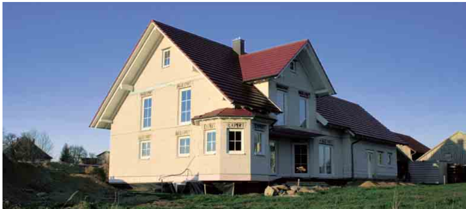
Der Traum vom Eigenheim: Die sehr niedrigen Bauzinsen lassen ihn wahr werden

Die sehr niedrigen Zinsen sind gut für Bauherren und Immobilienkäufer – die monatliche Belastung sinkt kräftig. Viel Geld kann auch sparen, wer jetzt eine Anschlussfinanzierung braucht.