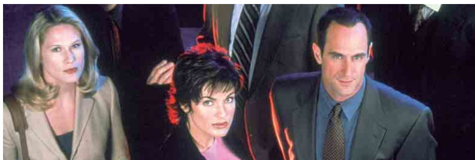
Erfolgsserie Law & Order – ab September die zweite Staffel auf RTL II

Vermutlich nur noch 2005 möglich: Für Anleger mit Spitzensteuersatz lohnt es sich oft, das hohe zu versteuernde Einkommen zu reduzieren und die Steuerlast in die Zukunft zu verschieben.